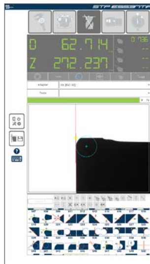
measuring icons library libreria icone di misura