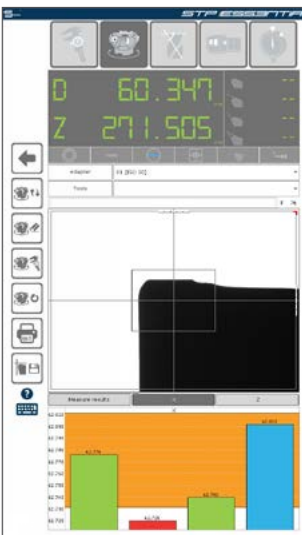
RunOut function funzione RunOut