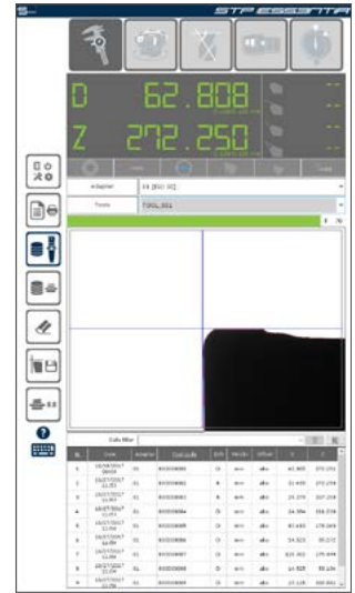
manual measurement misura manuale